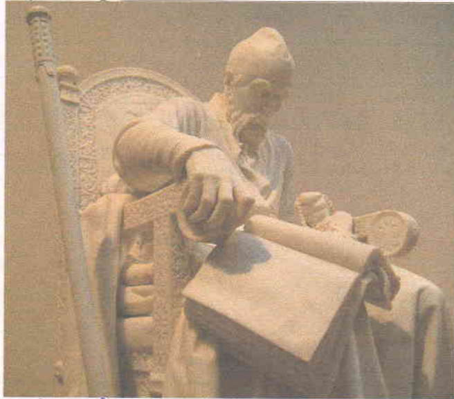
А. Ярослав Мудрый —