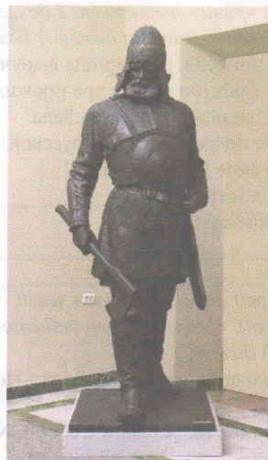
Г. Ермак Тимофеевич +

13. Прочитайте отрывок из исторического источника и ответьте на вопросы. Всего 5 баллов.