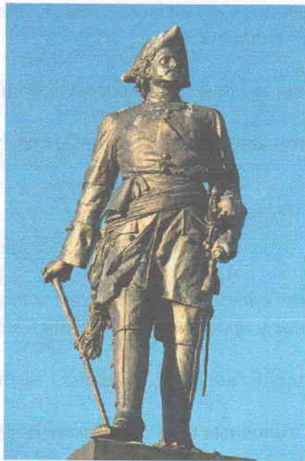
В. Петр I +